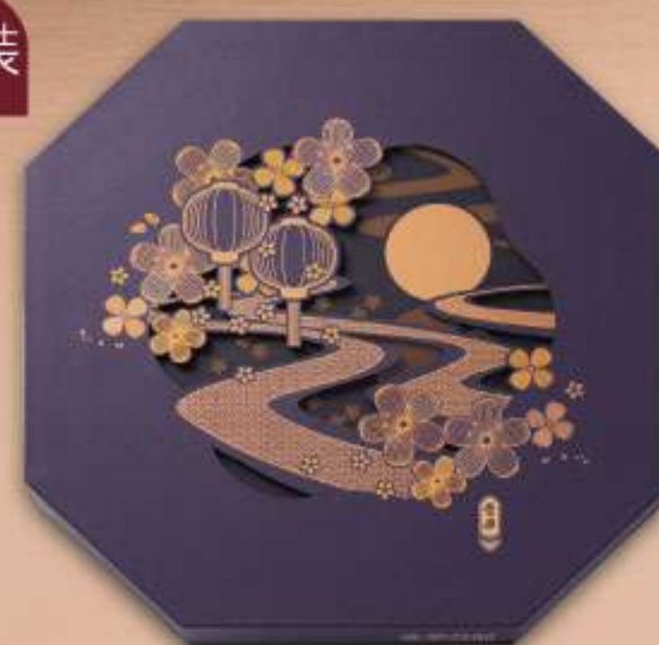
八星拱月 $548 六黃純白蓮蓉一個、蛋黃金黃蓮蓉(90克)、 蛋黃純白蓮蓉(90克)、陳皮豆沙(90克)、 五仁果子(90克)各兩個