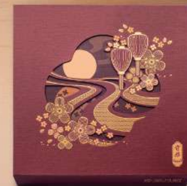
四合月 $438 雙黃金黃蓮蓉、雙黃純白蓮蓉、 珠姐XO醬金華火腿五仁、 雙黃豆沙各一個