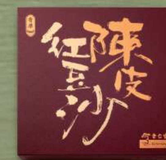
迷你余仁生陳皮豆沙月 八個裝 $315