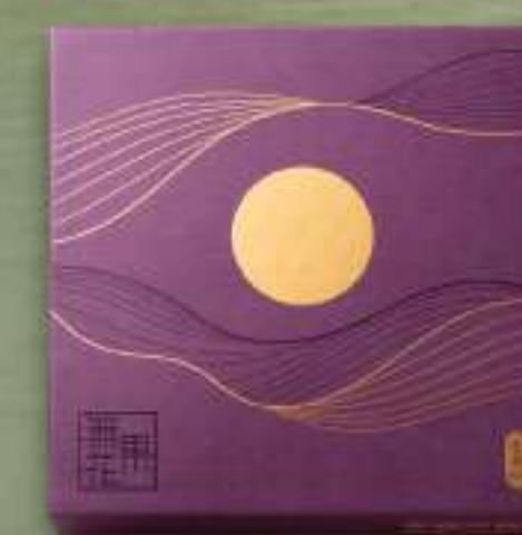
迷你無花果果仁月 四個裝 $165