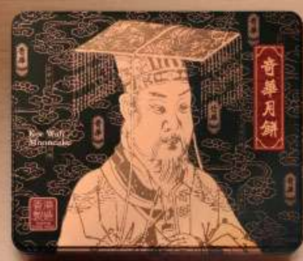
至尊月餅四個裝 $418 金華火腿五仁

揉合傳統與現代禮盒的設計，集合多款經典傳統口味月餅，演繹中秋團圓的寓意，細味多重風味。