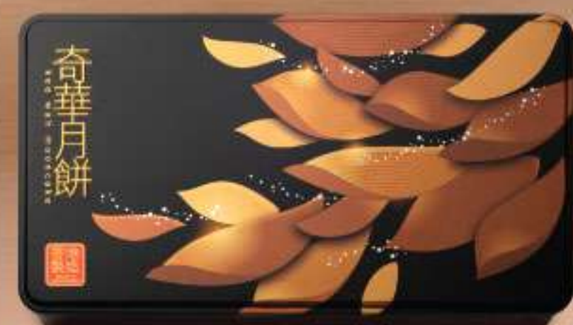
迷你至尊八個裝 $285 迷你金華火腿五仁