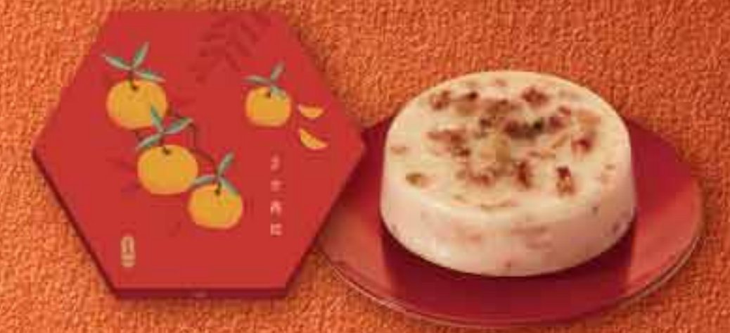
極上珠姐XO醬臘味蘿蔔糕