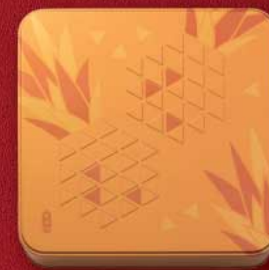
精緻禮盒 (九件裝) 券 $108