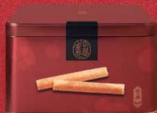
牛油 $115 券 (400克)