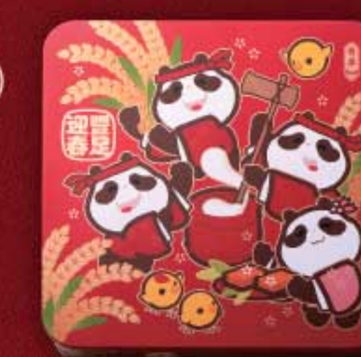
賀年熊貓曲奇禮盒 $108