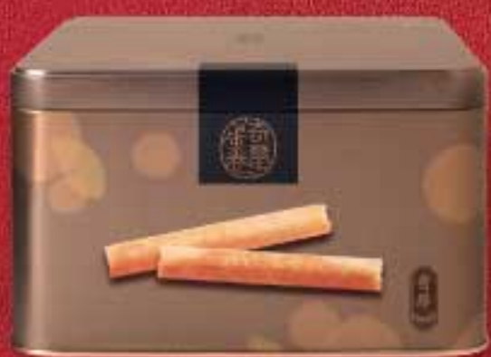
椰蓉 / 黑芝麻 $115 (400克)