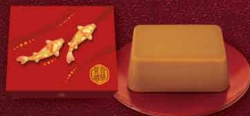
麥芽糖醇低糖亞麻糖年糕