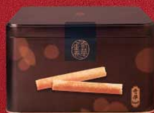
海苔 / 咖啡 / 特濃朱古力 $115 (400克)