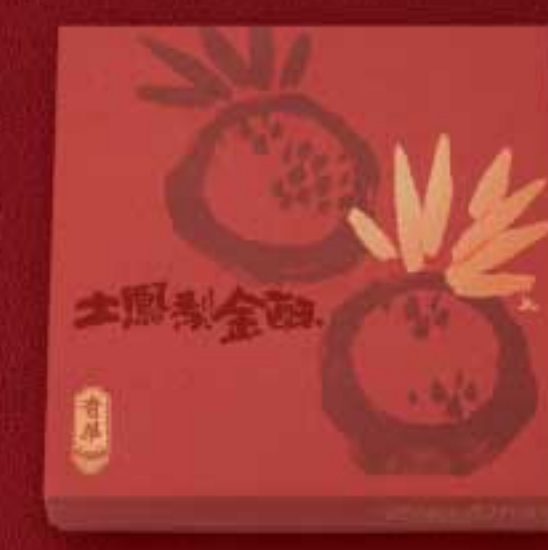
士鳳梨金酥禮盒 (六件裝) $115