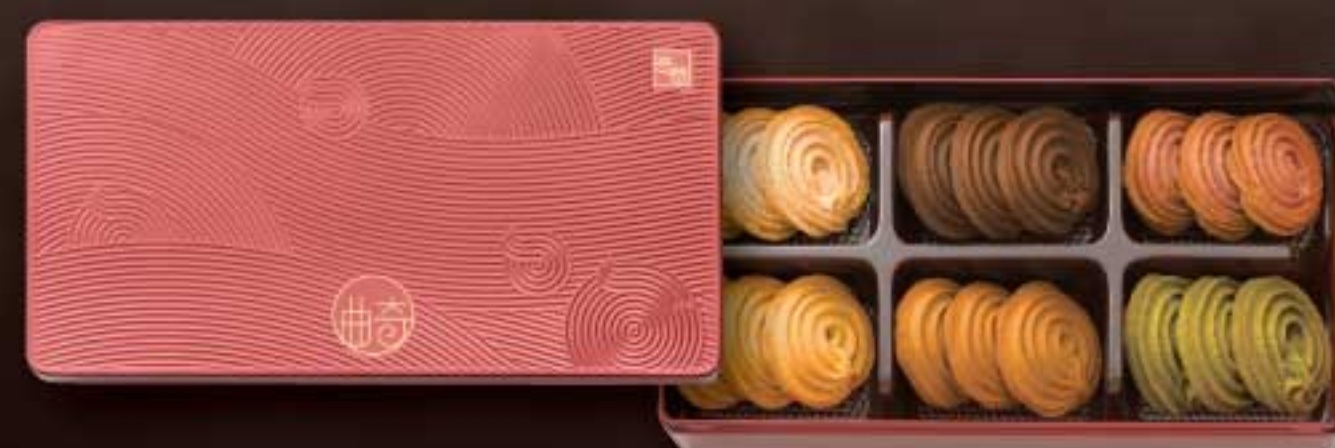
滋味什錦曲奇禮盒