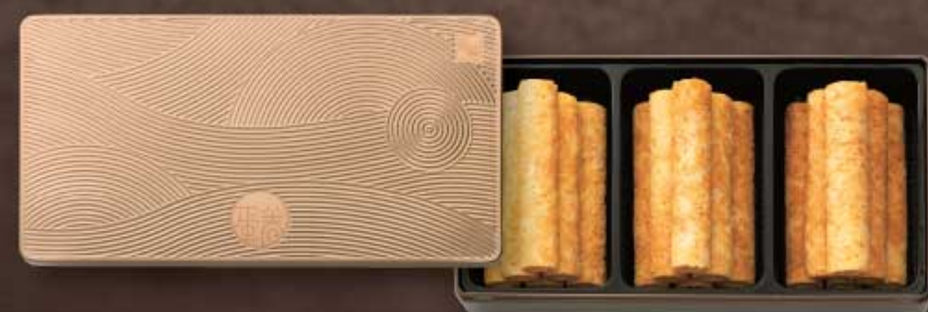
牛油蜂巢蛋卷禮盒