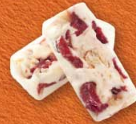
杏仁小紅莓鳥結糖