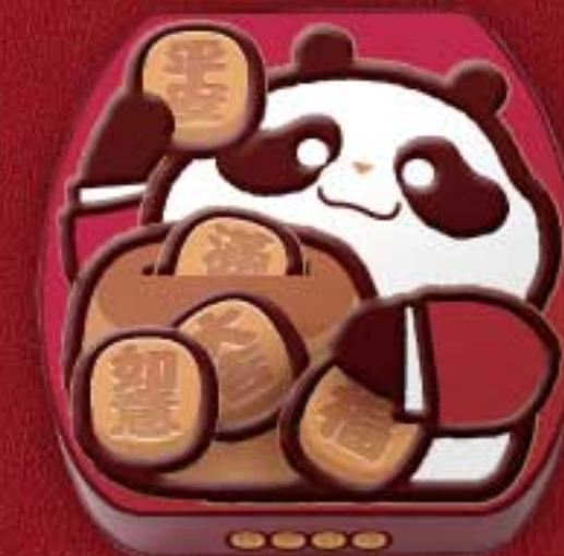
賀年熊貓小食禮盒 $108